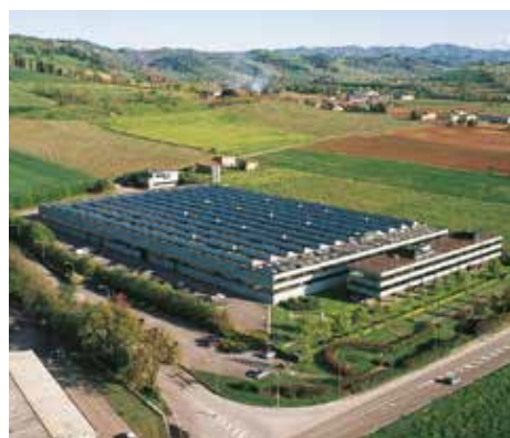
Sede Beghelli a Monteveglio di Valsamoggia (BO)

Fondato nel 1982 da Gian Pietro Beghelli, il Gruppo Beghelli progetta, produce e distribuisce - anche con offerta abbinata di prodotti e servizi - apparecchi per illuminazione tecnico professionale, è leader italiano nel settore dell'illuminazione di emergenza e realizza inoltre sistemi per la domotica e la sicurezza industriale e domestica.